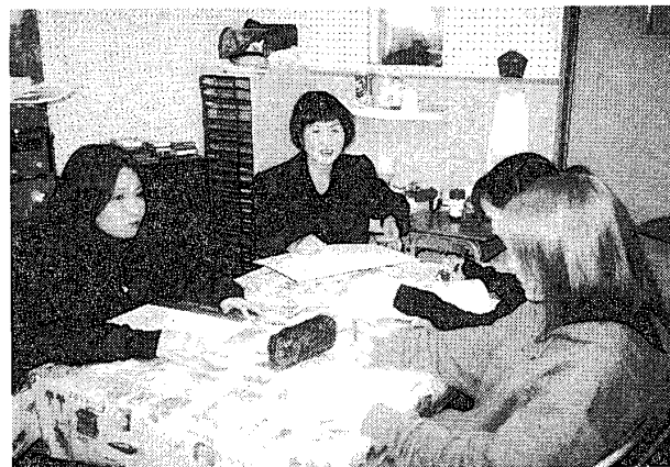
写真 2. 定期演奏会後の授業風景／反省会 (2001年11月・音楽棟433研究室)