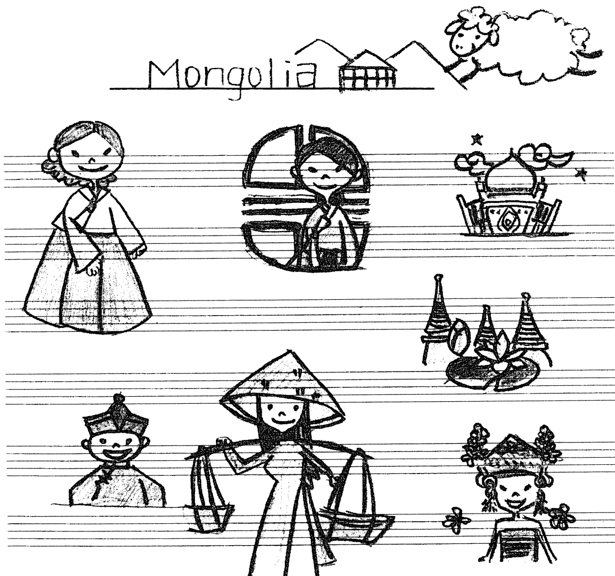
資料1. 作曲のイメージ作りのために学生が描いたイラスト

作曲が進んだ段階で台本の作成にとりかかった。(資料2.) 各楽器やマイクの配置、場面ごとの照明