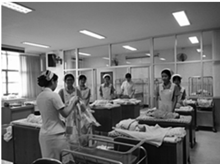
写真1. 母性看護学の演習風景

タイ王国の場合、男性でも助産師になることは可能であり、男性助産師による出産の介助に対して妊婦が抵抗を示す事例もほとんどないとのことであった。また、タイの場合、助産師が助産院のような施設を開業することはできない規定となっている。