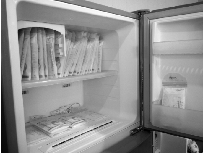
写真4. 搾乳後の母乳