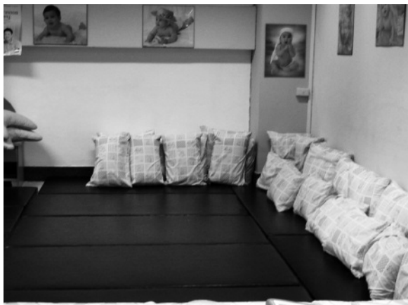
写真2. Childbirth Preparation Programme専用室